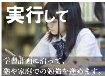
学習計画に沿って、塾や家庭での勉強を進めます。