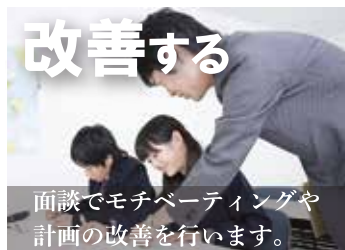
面談でモチベーションや計画の改善を行います。