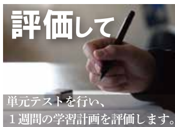
単元テストを行い、1週間の学習計画を評価します。